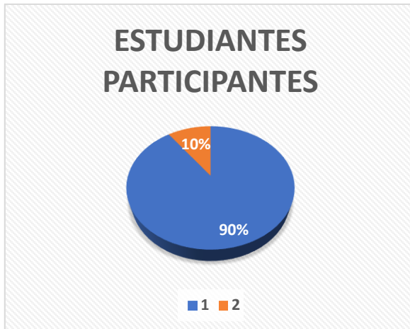
Figura 1. Participación docente

participar en esta investigación a través del consentimiento informado previamente.