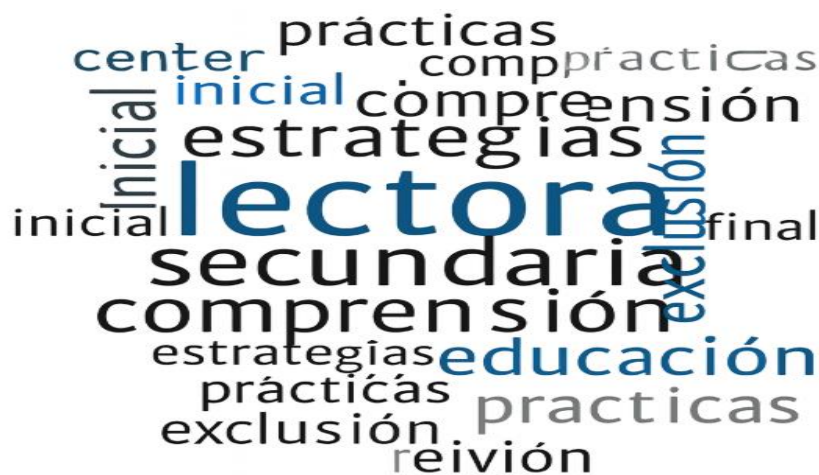
Figura 2. Nube de términos clave.

En la nube destacan de forma prominente las palabras “lectora”, “comprensión”, “secundaria”, “estrategias” y “educación”. Esto indica que el eje temático fundamental del artículo se centra en la comprensión lectora en estudiantes de educación básica secundaria, así como en el análisis de las estrategias pedagógicas que la favorecen.