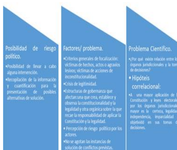
Figura 1. Relaciones entre factores y problemas.

El enfoque de la investigación fue de carácter cualitativo y de tipo exploratoria dado la necesidad de